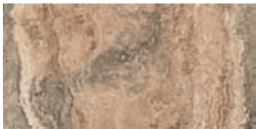
BASE BR-550591 625 x 310 x 10