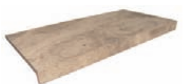
PELDAÑO RECTO EVO BR-551592 625 x 317 x 40