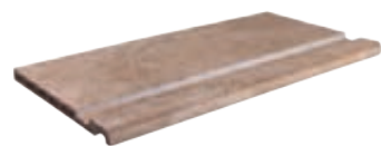
BORDE TÉCNICO BR-579592 625 x 330 x 23