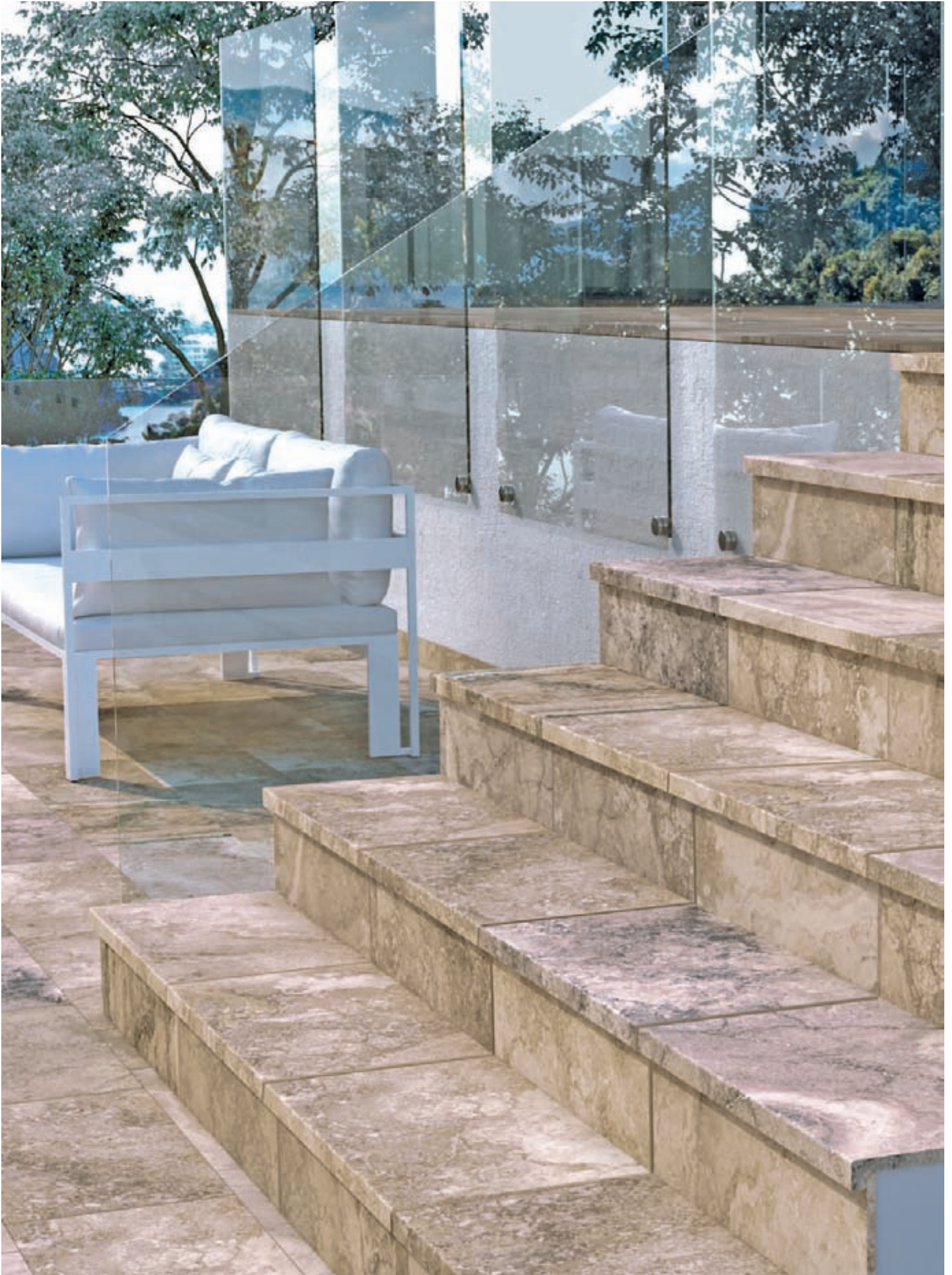
BERMEO. PELDAÑO RECTO EVO 625 x 317.