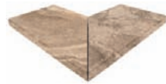
CARTABÓN EXT. PELD. RECTO EVO BR-570592 625 x 625 x 40