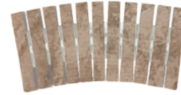
ESQUINA REJILLA CERÁMICA CURVABLE EVACUACIÓN: 19 m 3 /h BR-RJC59-500CU 500 x 245 x 25