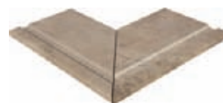
CARTABÓN EXT. BORDE TÉCNICO BR-581592 625 x 625 x 23