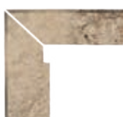
ZANQUÍN RECTO EVO BR-152592 Drcho. BR-153592 Izdo. 305 x 270 x 86