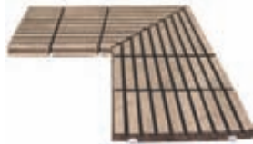
ESQUINA REJILLA CERÁMICA EVACUACIÓN: 19 m 3 /h BR-RJC59 450 x 450 x 25