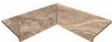
CARTABÓN INT. PELD. RECTO EVO BR-569592 625 x 625 x 40