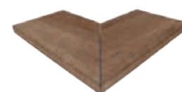
CARTABÓN EXTERIOR PELDAÑO RECTO EVO TA-570562 625 x 625 x 40