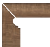
ZANQUÍN FIORENTINO XL TA-594562 Drcho. TA-595562 Izdo. 288 x 270 x 86