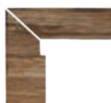
ZANQUÍN RECTO EVO CORTE TA-152562 Drcho. TA-153562 Izdo. 305 x 270 x 86