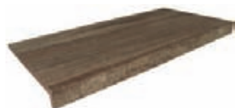
PELDAÑO RECTO EVO TA-551562 625 x 317 x 40