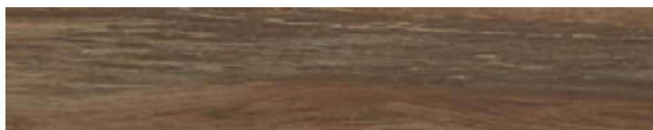
BASE 1200 TA-596561 1200 x 200 x 11