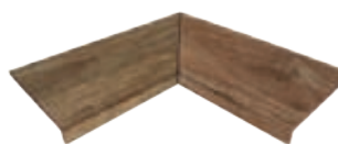
CARTABÓN INTERIOR PELDAÑO RECTO EVO TA-569562 625 x 625 x 40