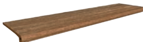
PELDAÑO RECTO FIORENTINO XL 1200 TA-566562 1200 x 330 x 40