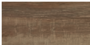
BASE TA-550561 625 x 310 x 10